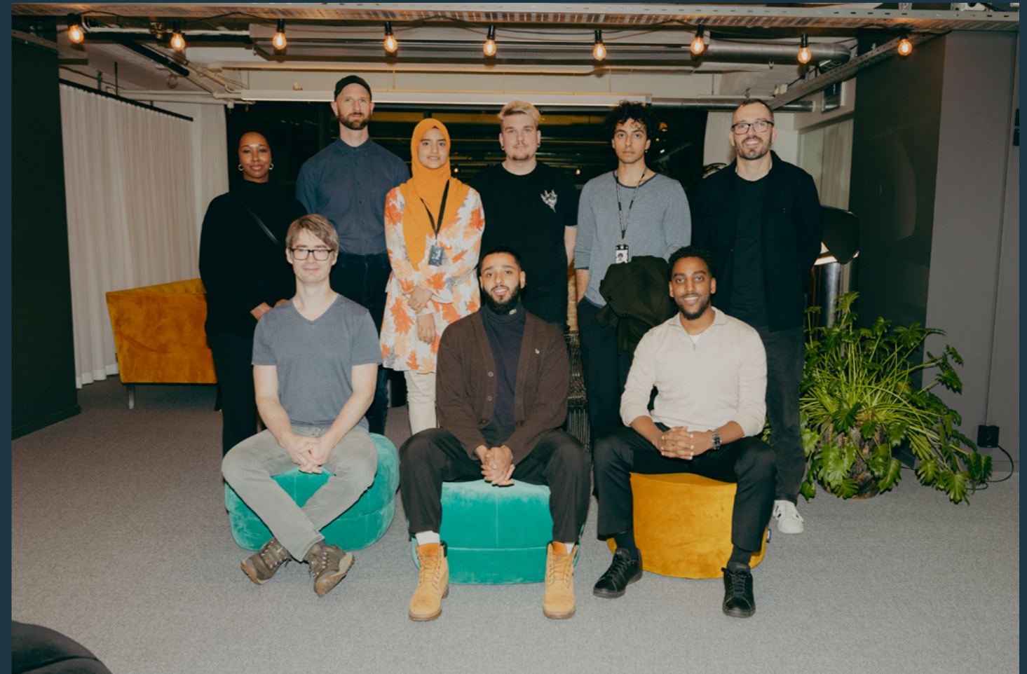
Changers Hub x Epidemic Sound Mentorship Program 2024

”Jag var en vanlig ortengrabb som höll på med sociala medier. Changers Hub hjälpte mig att gå från influencer till att bli en entreprenör som idag driver en framgångsrik agentur, med många företag och kreatörer signade till mig. Finns inte en chans på jorden att jag hade kunnat göra detta utan Changers Hub och den erfarenhet som de delat med mig.”